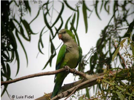
Myiopsitta monachus

La lista ha sido revisada a nivel taxonómico siguiendo las recomendaciones del Comité Taxonómico de la AERC (AERC TAC 2003). Entre otras cosas, se han reordenado los taxones, manteniendo la propuesta de la AERC de anteponer, después de las Ratites, las Galloanserae a las Neoaves, y se han reestructurado estos tres bloques a nivel interno siguiendo a Clements (2000). Se han añadido, además, las subespecies citadas cuando estas han sido determinadas.