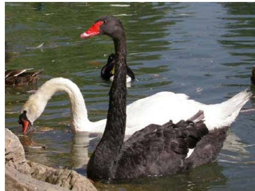
Cygnus atratus & C. olor

La lista tiene carácter dinámico, es decir, está sujeta a correcciones, revisiones y sucesivas actualizaciones. Cualquier tipo de información sobre especies invasoras en nuestro país puede enviarse a: exoticas@seo.org .