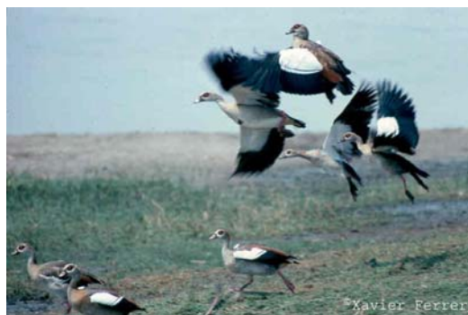
Alopochen aegyptiaca

Psittacula krameri , no se detallan por ahora las categorías que les corresponden en la tabla.