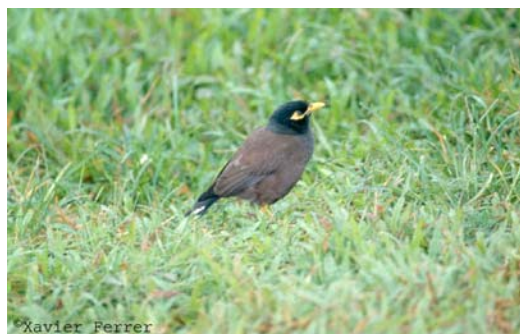
Acridotheres tristis

La distinción entre las categorías C y E depende de cada taxón en particular, aunque el GAE ha establecido un protocolo para asignar las especies a una u otra (Tabla 2). En caso de duda, debe mantenerse la categoría E hasta que existan pruebas para incluirla en la C.